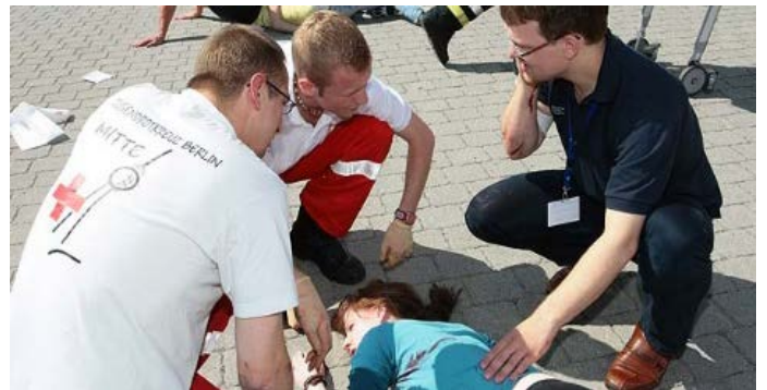
Der Kurs findet in Zusammenarbeit mit der DRK-Landeskatastrophenschutzschule statt! Gefördert durch

Der Lehrgang findet unter Beachtung der notwendigen Hygienerichtlinien statt. Weitere Informationen erhältst Du mit der Teilnahmebestätigung. Je nach Entwicklung des Infektionssgeschehens behalten wir uns vor, den Lehrgang anzupassen, abzusagen oder abzubrechen.